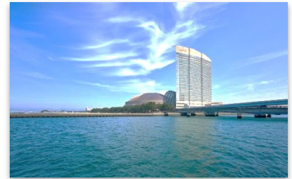
(ヒルトン福岡シーホーク)